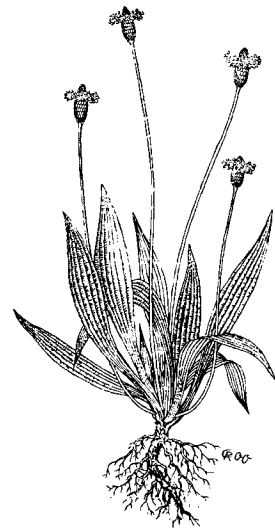
Plantago lanceolata - Spitzwegerich